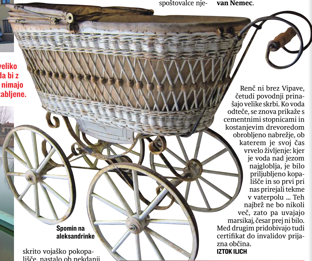
Spomin na aleksandrinke