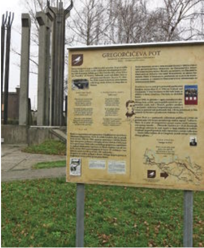
pomenik renškim zidarjem 1 začetek Gregorčičeve poti