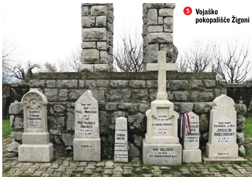
5 Vojaško pokopališče Žigoni