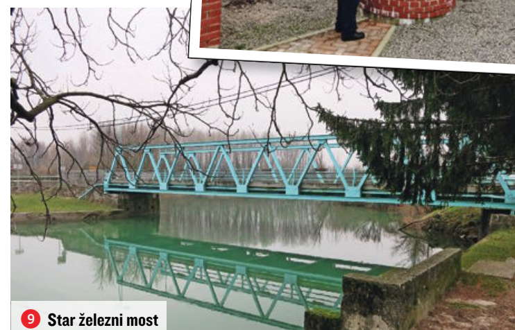
9 Star železni most

doline potoka Lijak je že pred tem udarniško osušilo 5000 brigadirjev in prostovoljcev. Vračamo se po vzhodnem robu doline, se povzpne mo v vas Vogrsko in se na drugem koncu pomola mimo nekdanjega gradu, v katerem je zdaj šola, ter cerkve sv. Justa spet