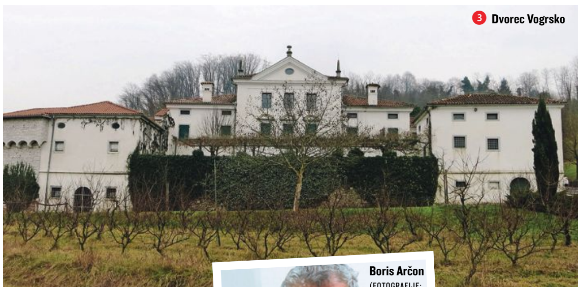
3 Dvorec Vogrsko

O leta 2006 ustanovljeni občini Renče - Vogrsko z (zaokroženimi) 30 kvadratnimi kilometri, 4500 prebivalci in 1180 hišnimi številkami, največkrat slišimo takrat, kadar Vipava prestopi bregove in pusti za seboj opustošenje. Najhuje je bilo leta 2010, na robu katastrofe tudi lani. A je tukaj še veliko drugega, na kar je vredno opozoriti popotnike, ki po cestah in železnici brzijo skozi Dombrovo in Volčjo Drago proti Novi Gorici in naprej v Italijo ali od tam prihajajo.