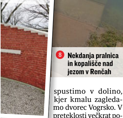
8 Nekdanja pralnica in kopališče nad jezom v Renčah

spustimo v dolino, kjer kmalu zagledamo dvorec Vogrsko. V preteklosti večkrat porušeni ali poškodovani in znova pozidani grad je zdaj v zasebnih rokah, a odprt za poroke in kulturne prireditve, pripomni Boris Arčon. Pot nadaljujemo proti Dombravi, kjer se pri železniški postaji Okroglica – postavljeni prav zaradi množice udeležencev zborovanja, še opozori vodnik – vrnemo na regionalno cesto. Že pred železniškim nadvozom jo zapustimo in se skozi Bukovico zapeljemo pro-