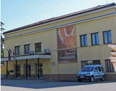
1 Kulturni dom v Bukovici

ndarne aleksandrinke, ki jih je veliko prav iz teh krajev odšlo v Egipt, da bi z služkom pomagale domačim, še nimajo spomenika, niso pa pozabljene.