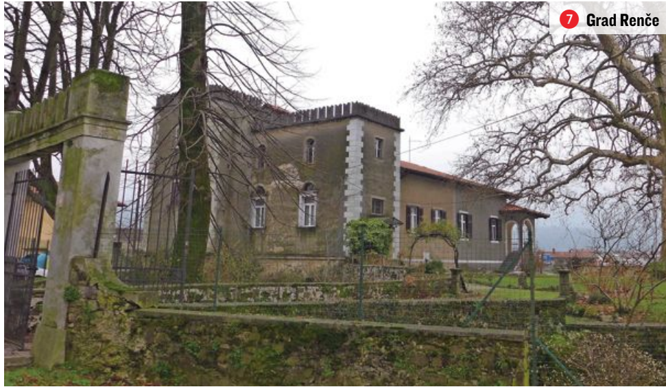
7 Grad Renče